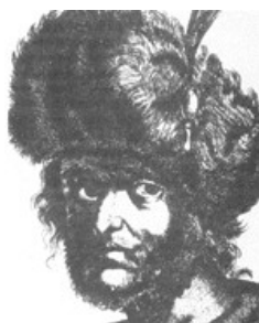
Лжедмитрий II Фёдорович

8. Предводитель восстания 1606 - 1607 гг. Призывал холопов и посадских убивать своих господ и богатых купцов и переходить на его сторону. В то же время жаловал приближенным поместья. Был разбит под Москвой, после взятия войсками царя Тулы сослан в Каргополь, где ослеплен и утоплен.